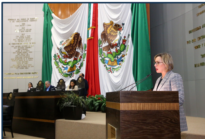
* Pendiente de Dictamen. ** Dictaminada Pendiente de Votación en Pleno.